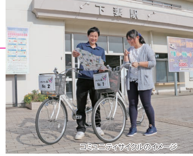
コミュニティサイクルのイメージ

市では、地域の活性化および市街地再生によるにぎわいのある街づくりを目標に事業を推進している、砂沼周辺地区都市再生整備計画事業の目標達成に向けて、「コミュニティサイクルの試験運行」を実施し、導入効果の検証を行います。コミュニティサイクルを利用した皆さまには、「利用時アンケート」にご協力ください。