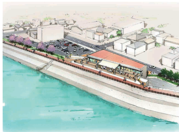
砂沼周辺都市再生整備計画事業の砂沼エントランス(仮)完成イメージ