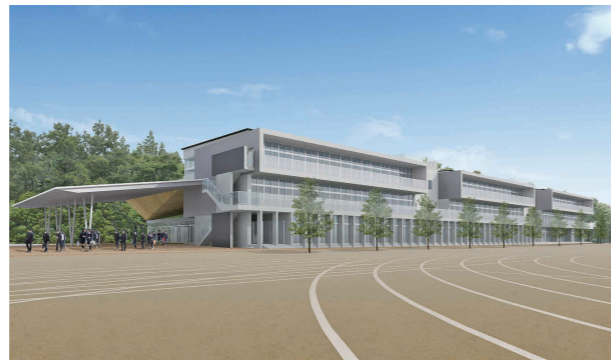
下妻中学校改築事業の新校舎完成イメージ