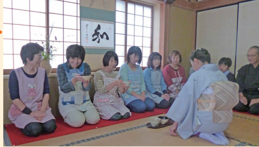
数須自治会での世代交流事業(茶道体験)