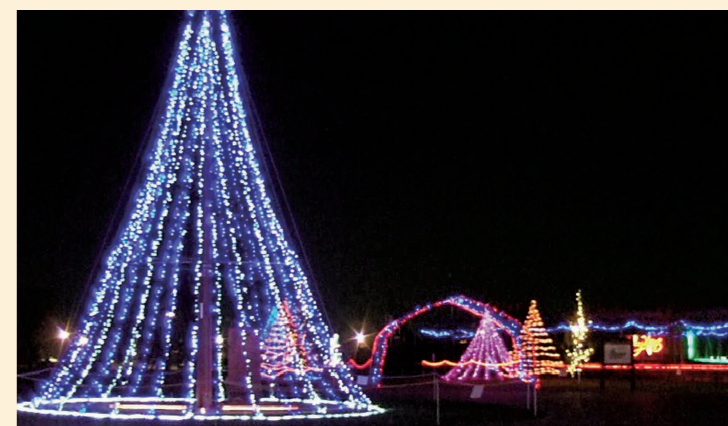
やすらぎの里公園での地域交流事業(イルミネーション)