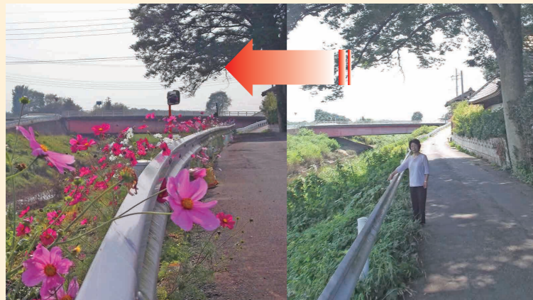
除草後に種まき、コスモスが咲きました

※平成28年度から助成期間・率が拡充され、申請3年目から5年目まで補助率が2分の1になります。