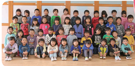
◀年長児(ゆり組)の皆さん