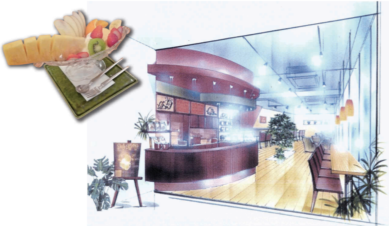
カフェ・レストランのイメージ

今後、本市の観光・物産や砂沼をPRしていく同施設を、大いに盛り上げてくれることが期待されます。