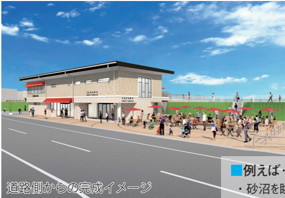
道路側からの完成イメージ