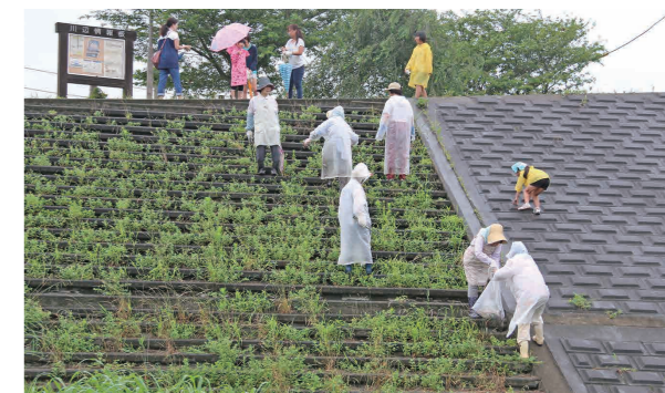
合羽姿で堤防のごみを熱心に拾う参加者(鬼怒川・大形橋上流左岸で)

同クリーン大作戦は、鬼怒川・小貝川の流域市町村と栃木県・茨城県および国土交通省下館河川事務所などで構成する「鬼怒川・小貝川流域ネットワーク会議」の広域イベントの一つとして、また7月が河川愛護月間であることから、沿川住民、河川敷占有者、河川利用者の他、各種団体の協力を得て、河川敷のごみを一掃することにより、常に河川を美しく保ち、正しく安全に利用する運動を推進するものです。今年で26回目を迎えています。