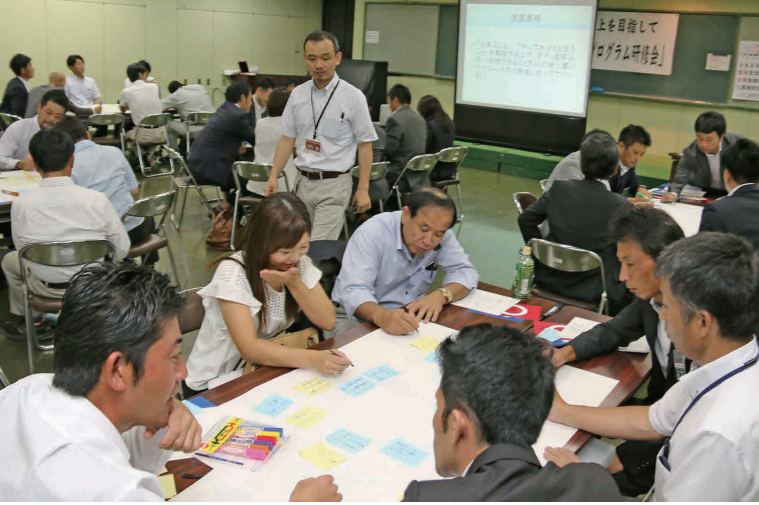
思ったことを附箋に書き出しグループ討議する参加者たち

みんなの力で防災に強いまちづくりを実践しようとして下妻青年会議所主催の「協働型災害ボランティアプログラム研修会」が下妻公民館で開催され、同会議所メンバーをはじめ、ボランティア団体、市社会福祉協議会、市職員など60人が参加しました。