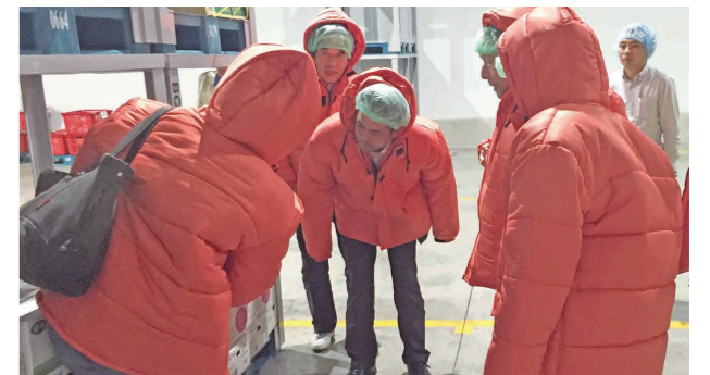
タイの低温倉庫内でメロンの保管状況を確認する海外派遣一行