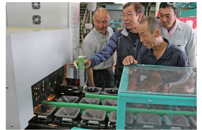
光センサーレーンを見学する式典出席の組合員たち