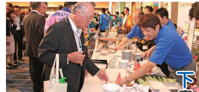
大玉すいかの試食を手にする参加者

東京都およびその近郊に在住・在勤する茨城県出身者で組織される「茨城県人会連合会」の懇親会で、下妻市の特産品や観光をPRしました。