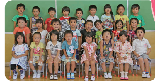
◀年長児・年中児の皆さん