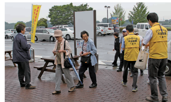
道の駅しもつまの買い物客などに不法投棄防止を呼び掛ける県・市職員