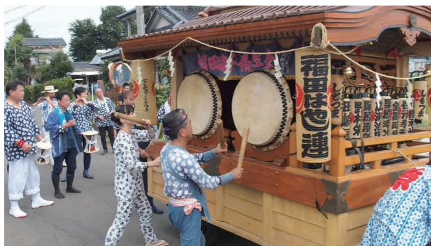
整備された山車、太鼓で演奏する福田はやし保存会のメンバー

福田自治会では、平成28年度宝くじの助成を受けて、エアコン等の公民館備品と太鼓、山車の台車などの祭事用品を整備しました。