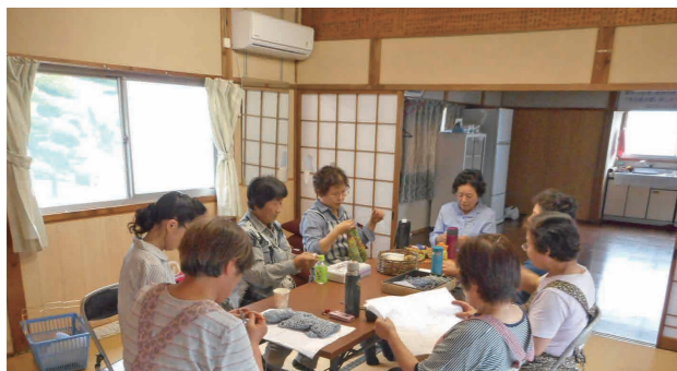
エアコンが整備され快適になった公民館での手芸教室