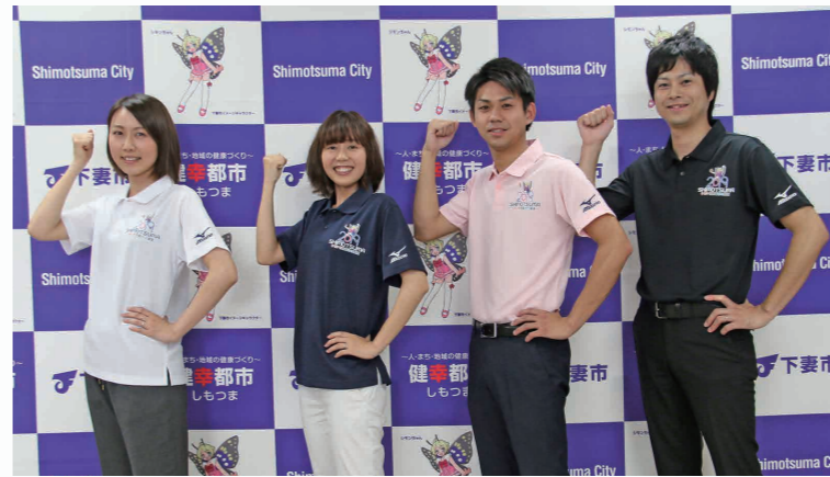
PRポロシャツの色は、左から白、紺、ピンク、黒の全4色。