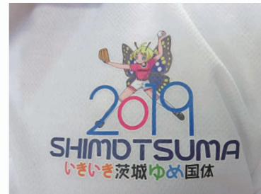
胸左：ソフトボールの投手になった市イメージキャラクター「シモンちゃん」をプリント