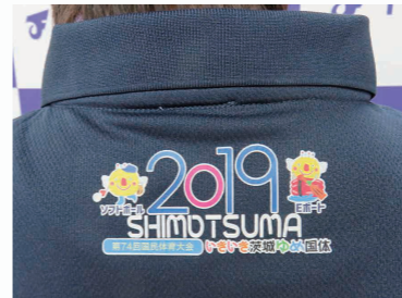
背中：茨城国体マスコットキャラクター「いばラッキー」の下に、「ソフトボール」「Eポート」の文字をプリント