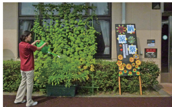
正面玄関前のゴーヤのグリーンカーテン