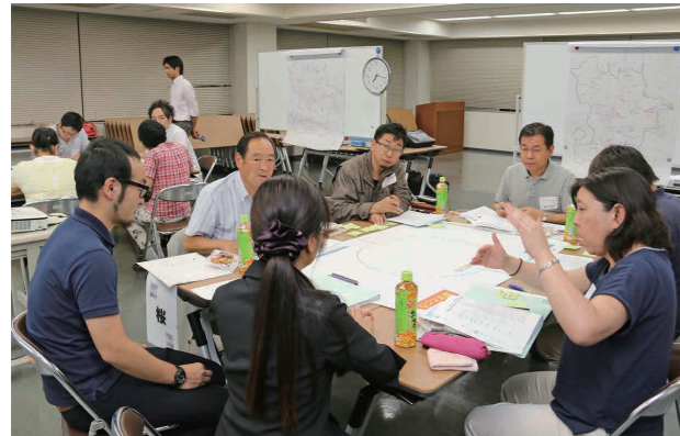
グループ討議で意見交換する委員たち

市では、「公共施設の将来のあり方」について、市民と現状や課題を共有しながら具体的な検討を行おうと、「公共施設を考える市民ワークショップ」の第1回会議を8月31日、市役所第二庁舎で開催しました。