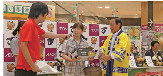
抽選会で当選を喜ぶ買い物客にコメントを求める司会のフルーツポンチ・村上さん(左)

同イベントでは、茨城県出身のお笑い芸人「フルーツポンチ」の村上健志さんが司会を務め、下妻甘熟梨などが当たる抽選会では当選番号が発表されるたびに歓声や笑いが沸いていました。