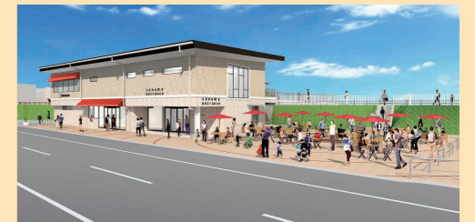
「下妻市観光交流センター さん歩の駅サン・SUNさぬま」完成イメージ