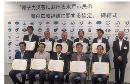
協定書を取り交わした関係市町と県の代表者(つくば市役所で)

協定書には、避難所の開設や物資の確保など初動対応に関する取り決めや平素から情報交換を行うなどの取り決めが盛り込まれ、自治体ごとの具体的な受け入れ人数や避難場所については今後調整するとしています。県の広域避難計画では、水戸市民約27万人のうち約10万人が県内で避難し、約17万人が群馬、栃木、埼玉、千葉の4県に避難すると定めています。