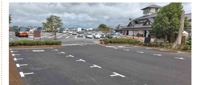
車が混雑した時にはぜひご利用ください