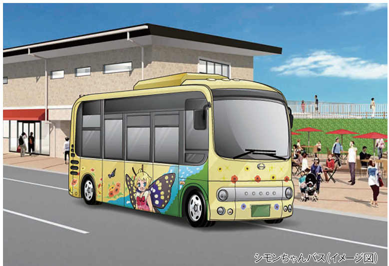
シモンちゃんバス(イメージ図)

市では、公共交通網のマスタープランとして、平成28年3月に「下妻市地域公共交通網形成計画」を策定しました。この計画の重点プロジェクトの一つとして、市街地内の日常生活の移動、砂沼地区への観光客の移動に利用できるコミュニティバスの実証運行を平成29年1月から実施します。