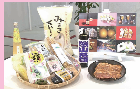
ふるさと納税お礼の品々