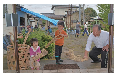
数須自治会による世代交流事業