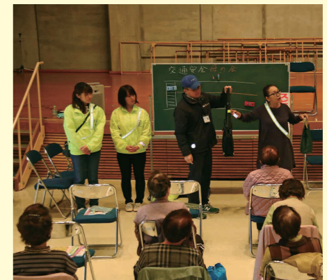
交通安全母の会による交通教室(11月22日、千代川公民館で)

反射材の無料配布 市では、市内在住の方を対象に反射材(タスキ、リストバンド)を無料で配布しています。ご希望の方は、消防交通課(本庁舎2階)またはくらしの窓口課(千代川庁舎1階)へお越しください。