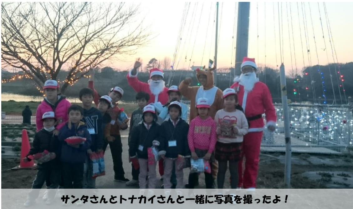
サンタさんとトナカイさんと一緒に写真を撮ったよ!