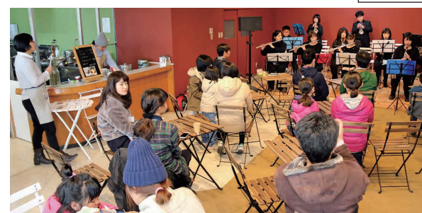
カフェとミニライブを楽しむ来場者(2月5日、かふえまる店舗内で)