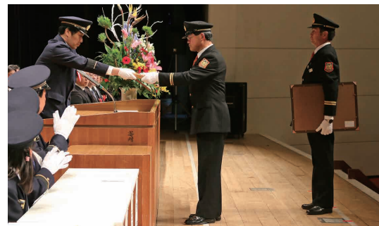
消防・水防活動の功労者を称える表彰式