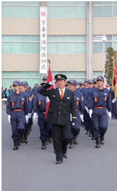
勇ましい入場行進

防火・防災への意識の高揚を図る新春恒例の「平成29年下妻市消防出初式」が1月8日、地元選出の国会議員などを来賓に迎えて行われ、消防職員と消防団員あわせて約400人が参集しました。