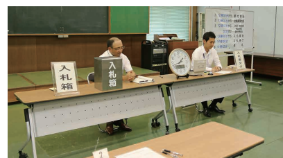
平成28年度執行の不動産公売会場