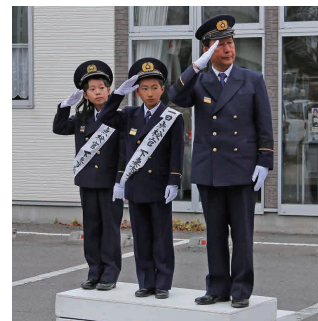
市長と一日点検官による車両観閲