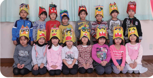
◀年長(ゆり組)の皆さん