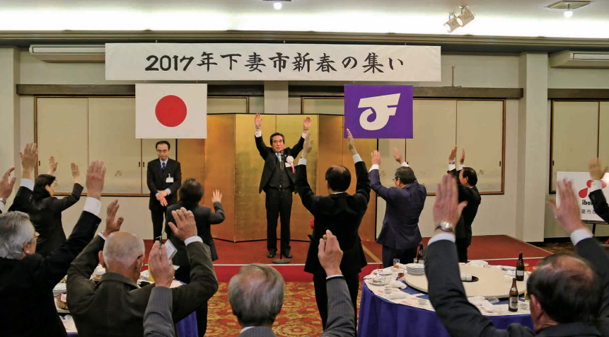
2017年下妻市新春の集い