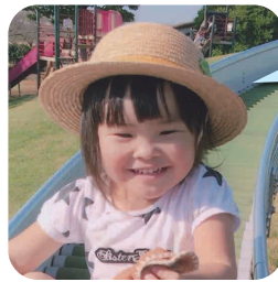
つかし ふつき 3歳時点 (下妻いずみ幼稚園)