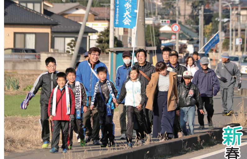
会話を楽しみながら歩いて心地よい汗を流す参加者

会場では、主催者をはじめ、地元選出の国会議員、県議会議員、市議会議員、各種団体や市関連企業の代表者など参加者246人が新年のあいさつを交わしながら談笑するなど、和やかな雰囲気の中で下妻市の飛躍を誓い合いました。