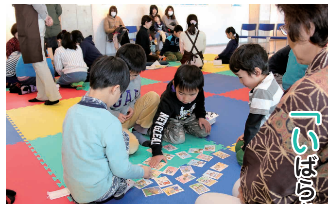
手を伸ばして札を取る児童