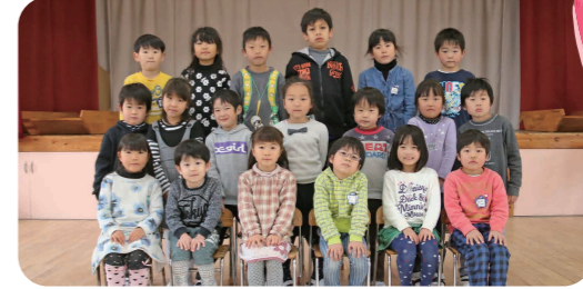
◀年長(ほし組)の皆さん