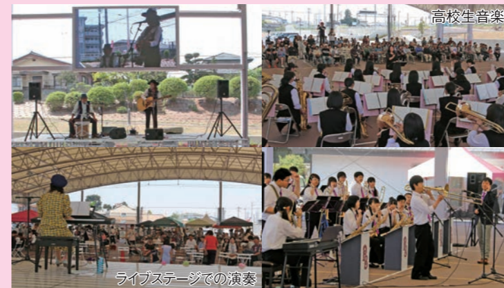
ライブステージでの演奏