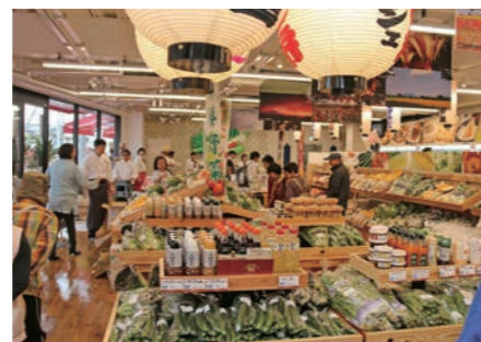
下妻産をはじめ県内の新鮮野菜、加工品や農産物などの物産販売や展示等を行う下妻マルシェ