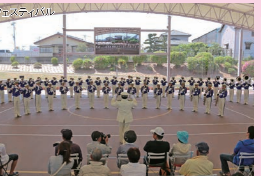
高校生音楽フェスティバル

音楽ライブや音楽祭など野外音楽ライブハウスとして活用することができて、大型ビジョンでのパブリックビューイングにも対応可能です。