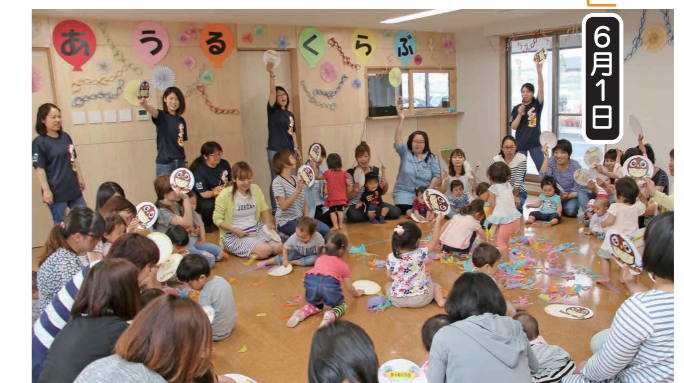
うちわゲームを楽しむ参加者

子育て支援センターは、子育てに関する悩みや楽しさを色々な方と共有し、自由に情報交換ができる場です。出張型地域子育て支援センター「あうるくらぶ」は6月1日から毎週木曜日、わいわいハウスに出張開設し、今後もピラティスなどの楽しいイベントが開催される予定です。