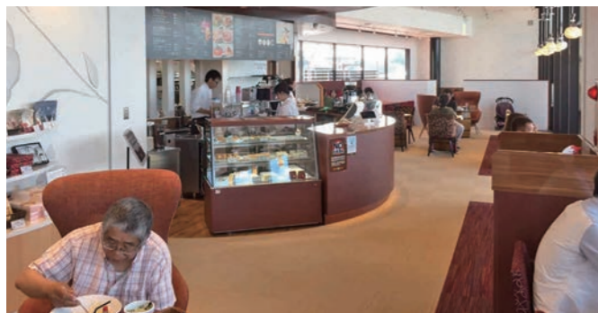
砂沼を眺望しながら飲食が楽しめるカフェレストラン