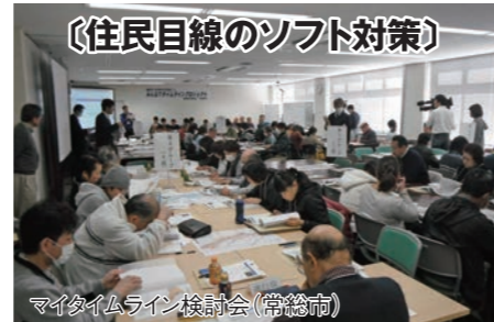
〔住民目線のソフト対策〕