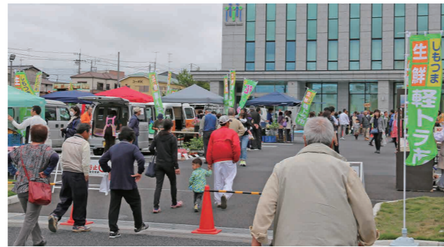
軽トラ市が開催された筑波銀行下妻営業部駐車場

下妻青年会議所により、下妻市、八千代町および常総市石下地区の事業所や飲食店が集い、親子で職業体験などができる「下妻スプリングモール2017 the職フェスJCI」がほつとランドさぬ北側多目的広場で開催されました。