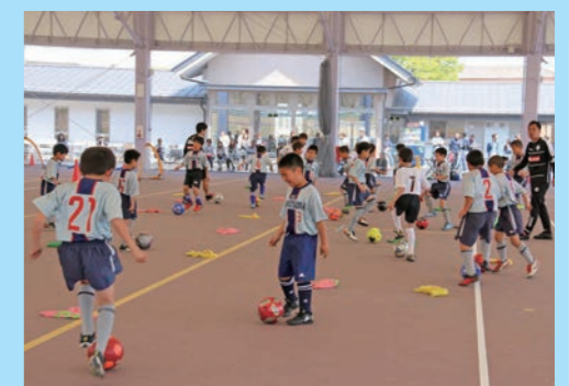
水戸ホーリホック少年サッカー教室

屋根付き広場では天候を気にせず運動会やサッカー教室などができ、B.E.step125ではスケートボードなどのイベント・教室ができます。