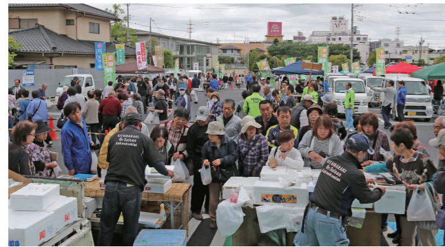
鮮魚などを販売する大津港水産加工業協同組合

軽トラ市は、しもつま生鮮軽トラ市実行委員会が毎月第2日曜日に9時から12時まで同会場で開催する予定であり、5月の軽トラ市では、先着200人に1パック100円の卵が販売されましたが、開始約10分で売り切れるほどの買い物客でにぎわいました。