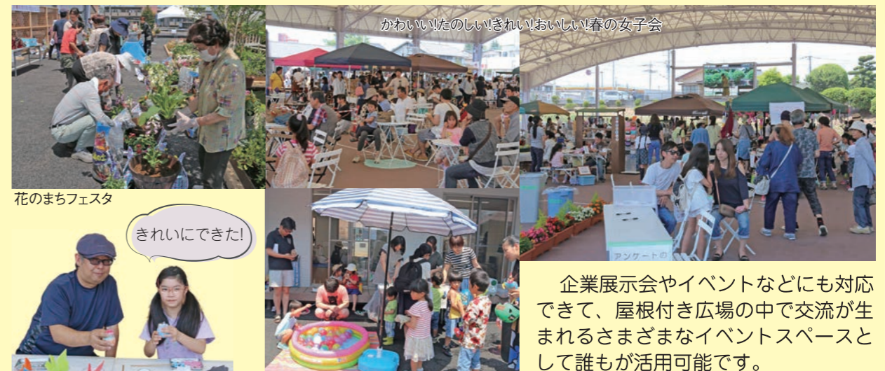
花のまちフェスタ