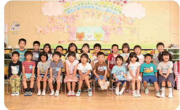
▲にし組・はな組の皆さん

「軽やかに 慢心せず 面白おかしく」 みなさん、こんにちは！私の人生、年代ごとに変化があります。40代になると幅広い年齢層の人々との素晴らしい出会いや感動がパンパンやってくる、これまでふたをしてきた私自身の箱を遠慮なく開けてくれました。情熱に燃えている人、調和を大事にする人、愛情たっぷりの人、常に冷静に判断する人、みなさんそれぞれ全く違います。が、とても素敵な人でした。 4年前に始めた月1回の朝のハイタッチあいさつ運動では、子どもたちの気持ち動では、子どもたちの気持ち動がストレートに出ていて、貴重な体験をさせてもらっています。 このような経験を踏まえて下妻市民であることに誇りを持ち、自分の個性をみんなのために活かすことができたらと考えています。 返事は0.2秒!早ければ早い方がいい。0.2秒で言える言葉はきっと現実化するはず?軽やかに慢心せず、面白おかしく!こんな自分でありたいです。 最後までお読みいただきありがとうございます。