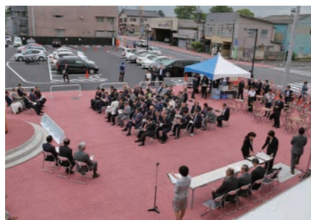
誰もが使える自遊空間、イベントなどにも活用できる広場