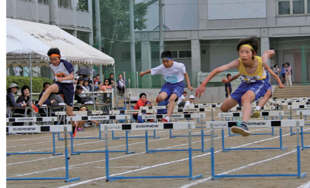
きれいにハードルを飛び男子80mハードルの選手たち

茨城県緊急医療情報コントロールセンター 休日や夜間に救急対応している 年中無休/24時間 小児科医療機関をお探しのとき ☎029-241-4199