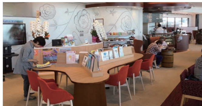
トイレや授乳室、無料Wi-Fi環境も完備の観光情報案内所