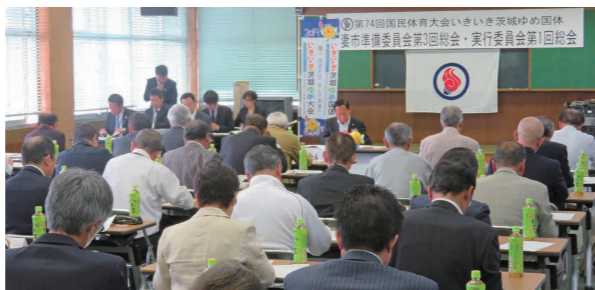
平成29年度事業計画などが審議された総会

平成31年に茨城県で開催される第74回国民体育大会(愛称:いきいき茨城ゆめ国体)へ向け、平成29年5月16日に開催した「第74回国民体育大会下妻市準備委員会第3回総会」では、更なる開催準備の推進を図るため、これまで「準備委員会」であった組織を「実行委員会」に改め、併せて「下妻市実行委員会第1回総会」を開催しました。