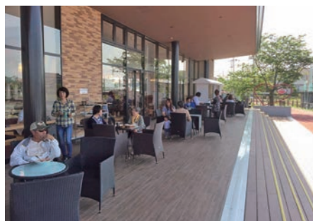
テイクアウトした商品をゆったりと楽しむことができるフリースペースのテラスデッキ