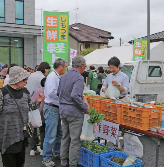
軽トラ横付けで販売される新鮮野菜