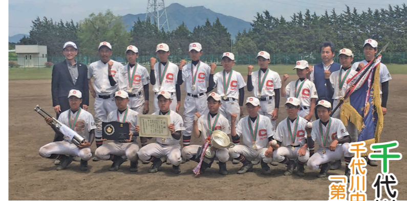
初優勝の千代川中野球部