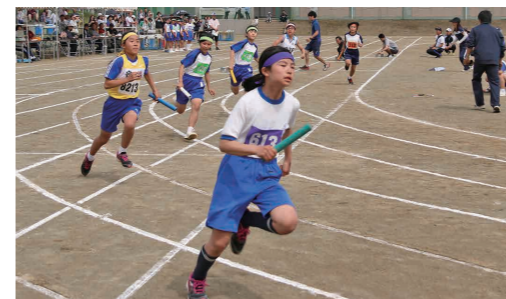
勢いよくスタートする女子4×100mリレーの選手たち