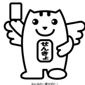
みんなの一票大切に!