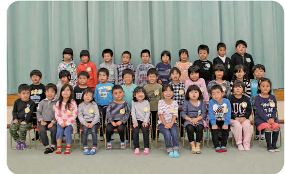
▲ほし組・にし組の皆さん

園庭で「トンボだ!」と元気に追いかける子どもたち。他にも、栗やドングリ、キノコ、たくさんの秋を見つけて、制作を始めました。 子どもたちの目には、キノコやドングリがこんなにかわいく見えているんですね。 みんなで秋探し… これからも続けていきたいと思います。