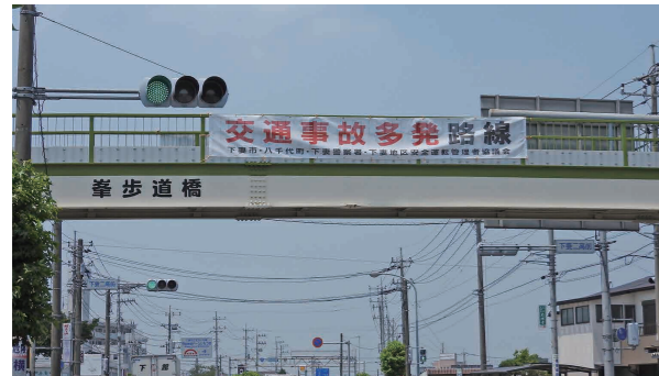
歩道橋に掲出された横断幕(歩道橋)

その結果、人身交通事故の減少率は、県全体の7.4%に対して、管内では16.6%、国道125号では35%と大きな効果をあげました。