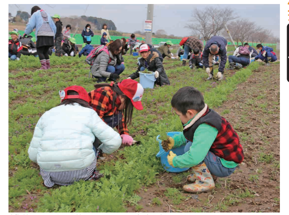
雑草を見分け草取りをする参加者たち

5月中旬～下旬の市内では同花畑と小貝川ふれあい公園の花畑一面に、色鮮やかなポピーの開花が期待されます。