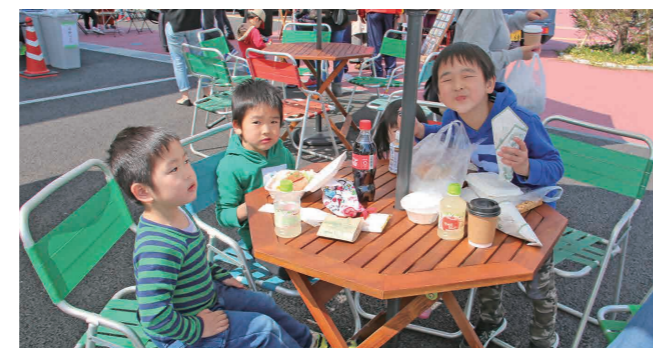
テーブルを囲み食事を楽しむ子どもたち