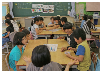
先進的な取り組みを推進する市の英語教育