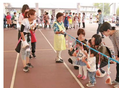
子育て世代の交流を図る「遊びの広場」