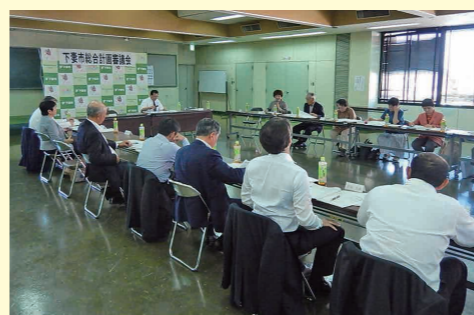
総合計画審議会にて計画内容などを審議する委員