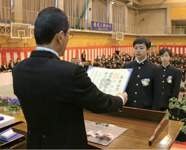
一人一人に卒業証書が手渡されました (千代川中学校)