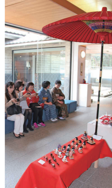
抹茶を味わう来館者

市民の手づくりのつるし雛や江戸時代後期のおひなさまなど多彩な計100点が展示される下妻市ふるさと博物館企画展「ひなに魅せられて」が開催されました。