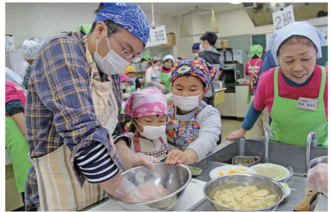
協力してひき肉を混ぜる親子

親子のふれあいや父親の家事への参加を目的に千代川公民館で料理教室が開催され、父親とその子どもたち14組34人が料理作りに挑戦しました。