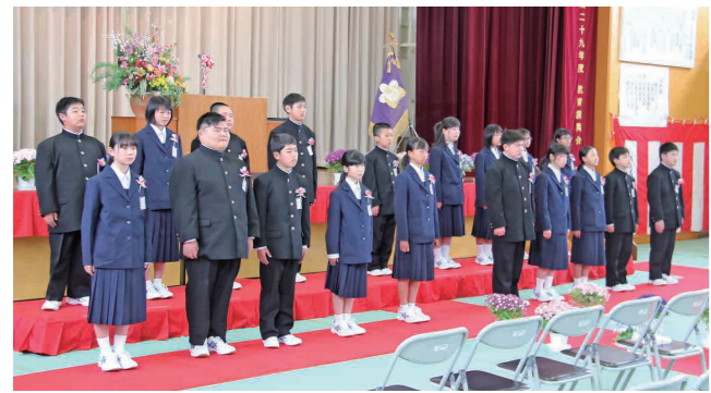
卒業生全員による別れのことば(騰波ノ江小学校)

また、3月20日には市内各小学校で卒業式が行われ、進学する中学校の制服を着て式典に臨んだ382人の児童が、6年間で大きく成長した姿を披露し、慣れ親しんだ学び舎をあとにしました。