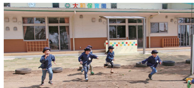
園庭で元気に遊ぶ子どもたち

保育園への入所の申し込みは、子育て支援課(市役所第二庁舎2階)で受け付けています。