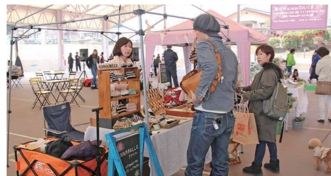
小物を選ぶ来場者

家族4人で栃木県下野市から遊びにきたという30代女性は「イベント会場が想像以上に広くて驚きました。子どもも楽しんでいるので、また来たい」と話してくれました。