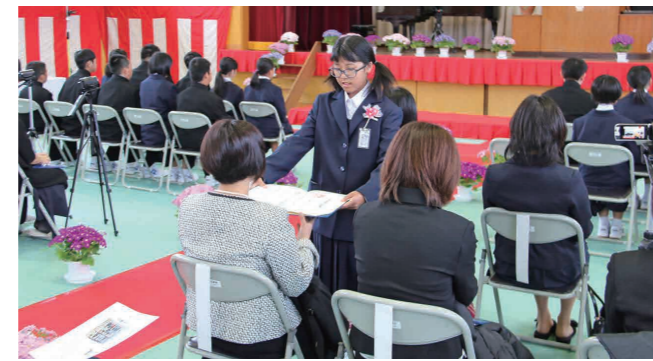
卒業証書を母親に渡しながら感謝の気持ちを伝える児童(騰波ノ江小学校)