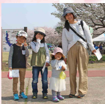
英語の授業をする外国人英語指導助手