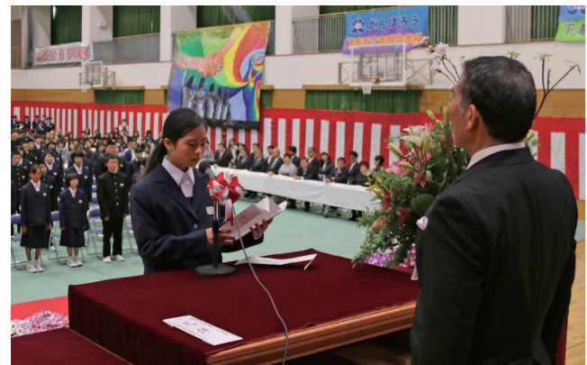
新入生代表による誓いのことば(東部中学校)