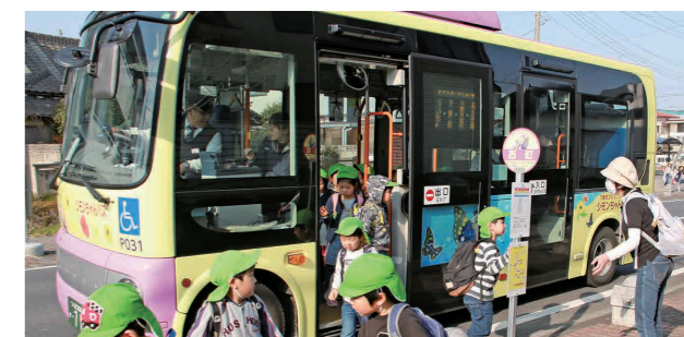
シモンちゃんバスを利用する子どもたち

これまでの現金・回数券(12枚綴り)の他に、ICカードが利用でき、さらに便利になります。