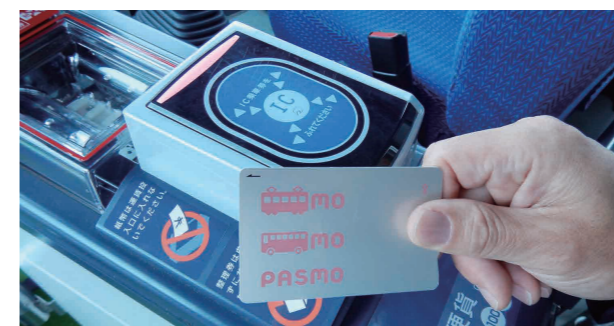
車内に設置されたICカードリーダー