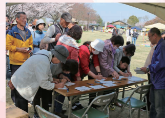
スタンプラリーの受付所