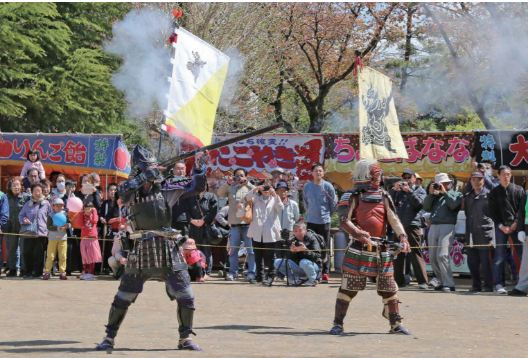
川越藩火縄銃鉄砲隊保存会による火縄銃演武

八千代町から夫婦で来場した男性(70代)は火縄銃の演武に「迫力がある。なかなか見られないから来てよかった」と話していました。