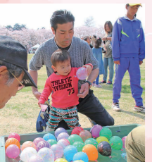
ヨーヨーすくいを する親子