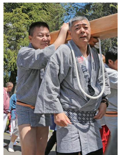
渡御を楽しむ参加者