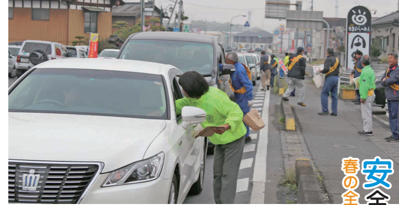
交通安全の呼びかけをする交通安全協会員