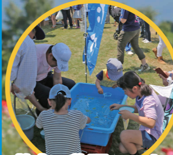
飲食・物販コーナー