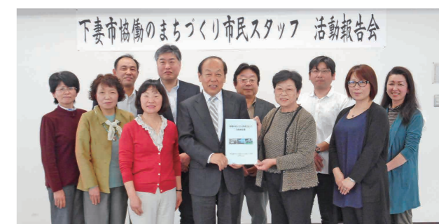
野中副市長に活動報告書を提出する市民スタッフ

今後も、市民・団体が共通の目的のために協調する市民協働や男女があらゆる分野に参画できる男女共同参画の取り組みを進めていきます。