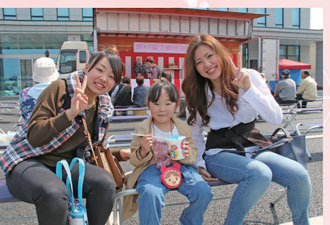
筑波銀行特設会場で売店を楽しんだ来場者