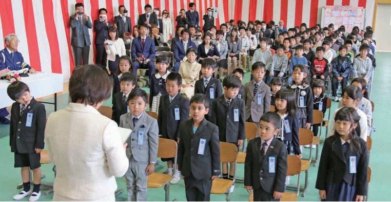
呼名される新一年生(宗道小学校)