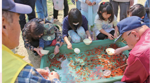
金魚すくいを楽しむ子どもたち