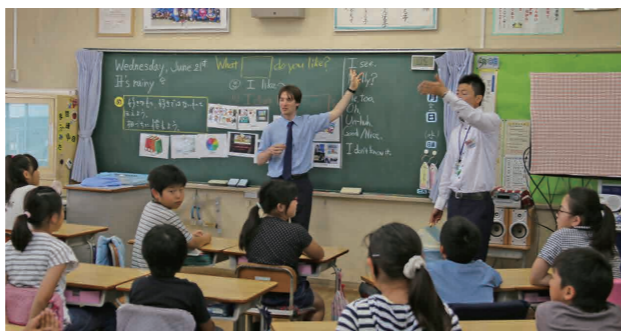
英語の授業をする外国人英語指導助手