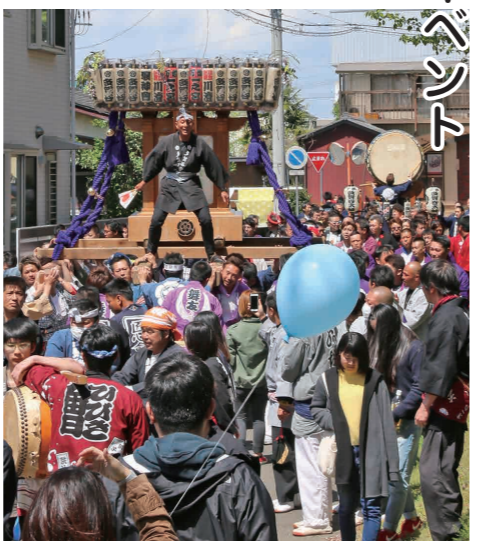
盛り上がる万燈神輿