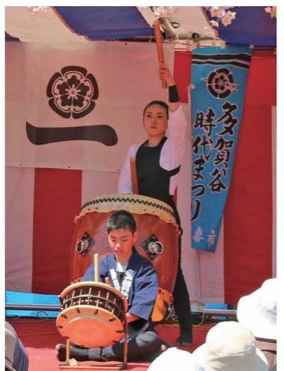
下妻多賀谷太鼓の演奏