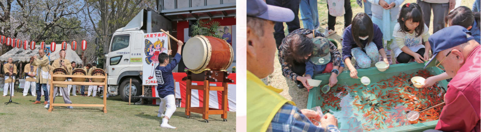
会場を盛り上げる大町はやし保存会の演奏