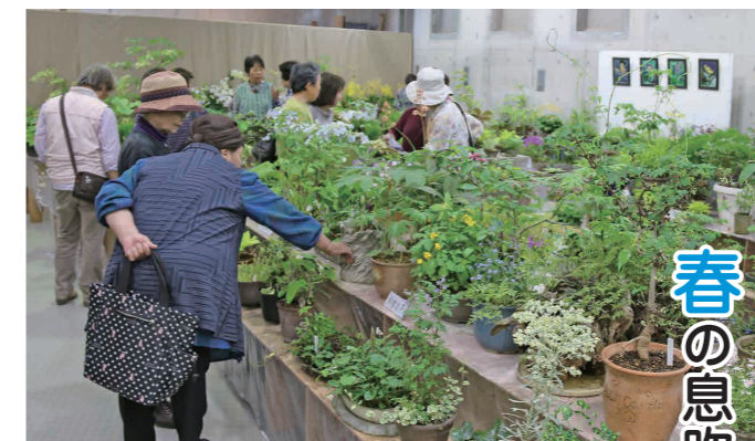
春の山野草を楽しむ来場者

春の全国交通安全運動(4月6日~15日の10日間)の一環として街頭キャンペーンが4月6日、本宿交差点と宗道十字路の2カ所で実施され、下妻警察署や市内交通団体などの関係者約80人が早朝の通勤ドライバーに、「飛び出さない 心のブレーキ 大切に」と書かれた交通安全グッズを配布しながら「安全運転」の大切さを呼び掛けました。