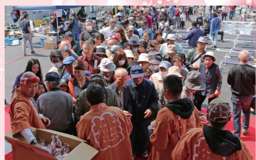
紅白もちをもらう来場者