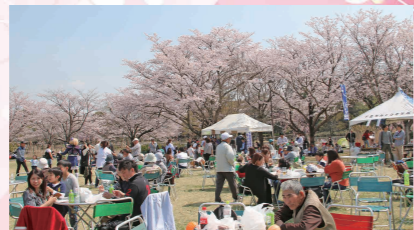
来場者でにぎわう観桜苑会場