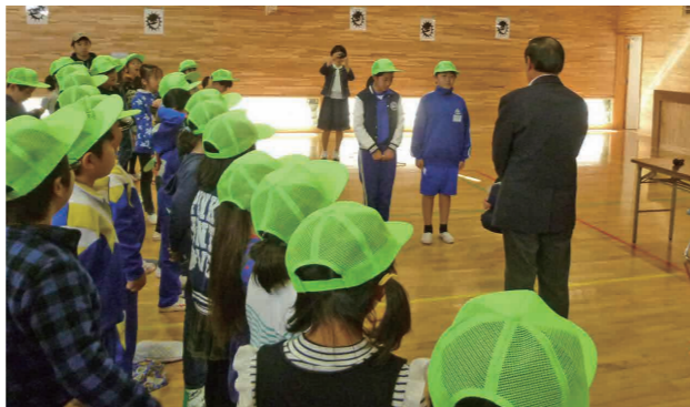
活動への意気込みを発表する団長と副団長

式の終わりには、「鬼怒川のことが分かってよかった」「鬼怒フラワーラインを守る活動を頑張りたい」「ジュニアスタッフの活動を頑張りたい」など児童たちからの感想発表があり、今後の積極的な活動が期待されます。