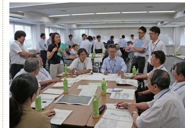
市職員も参加した市民会議

今後、市民会議は3回の会議を経て「基本計画策定に係る報告書」を作成し、市に提言する予定です。