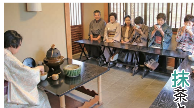
抹茶を味わう参加者

6月10日、「あやめ茶会」が砂沼広域公園・観桜苑の砂沼庵で開催されました。茶会は市茶道連盟香出水会が主催で行われ、市内外から約140人が参加しました。