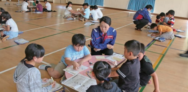
自分の逃げ方を討議する児童たち

国土交通省関東整備局下館河川事務所と下妻市は6月8日、大宝小学校の5年生45人を対象に防災教育の授業(出前講座)を行いました。