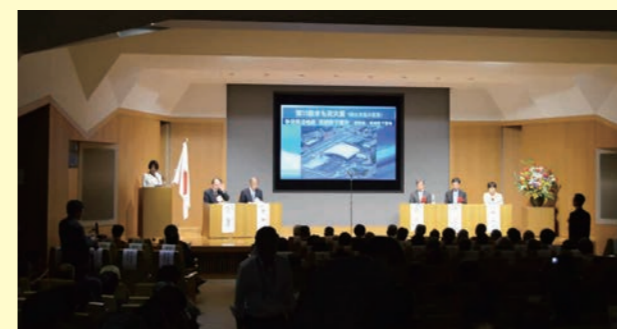
表彰式の会場(すまい・るホール)

市の取り組みは、まちづくりの積年の課題を解決する拠点施設(Waiwaiドームしもつま、さん歩の駅サン・SUNさぬま)の整備にあたり、市民協働で行った各種ワークショップによるまちづくりの担い手育成や、プレイスメイキング※1による事業効果促進など、産学官民が連携し多様な主体によるまちづくりの推進と継続性が特に評価されました。