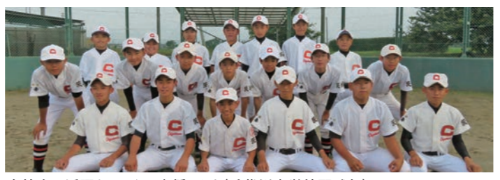
高校生の活躍をみんなで応援します(千代川中学校野球部)

大会の見どころ 強豪チームに打ち勝ち福井国体を目指せ! 関東ブロックから今年の福井国体に出場できるのは、わずか2チームです。 昨年の愛媛国体に、関東ブロック代表として出場した千葉県の男子チームが3位、女子チームは1位になるなど、関東ブロック大会は非常にハイレベルな戦いが予想されます。 今回の茨城県男子チームは下妻二高男子ソフトボール部の単独チームです。全国高校総体(インターハイ)の常連校であり、今年も見事、出場を決めるなど、強豪として全国に名をはせており、平成24年の岐阜国体には、茨城県選抜チームの主力として出場しています。 また、群馬県男子チームには、世界男子ジュニア選手権大会(U19)に出場する日本代表チームの投手がいます。世界レベルの投手を見ることのできるでしょう。