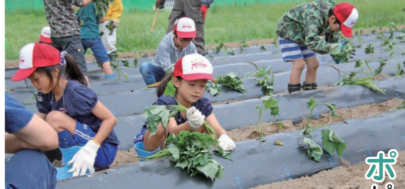
丁寧にさつまいもの苗を植える参加者

鬼怒フラワーライン(鬼怒川大形橋上流左岸河川敷)で、花と一万人の会が主催する「さつまいも定植大会」が行われました。