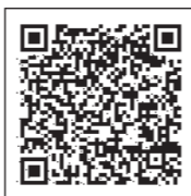
高齢者保健福祉計画・第7期介護保険事業計画

※標準給付費見込額は、団塊の世代が全て75歳以上となる平成37年度まで増加を見込んでいます