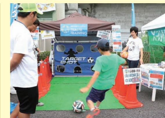
スポーツパークミッションラリー(イメージ)