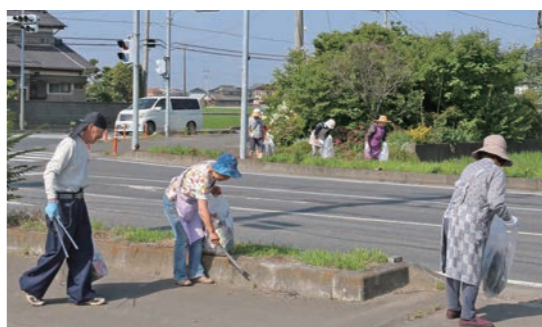
国道沿いを清掃する地域住民(鎌庭地区)