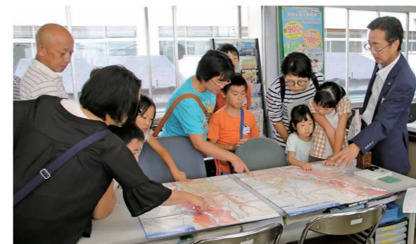
消防交通課でハザードマップを紹介する菊池市長(右)

意見交換会では、市へ猛暑による小中学校での暑さ対策や防犯対策などの要望があり、菊池市長からは今後の市政に役立てていきたいと話がありました。