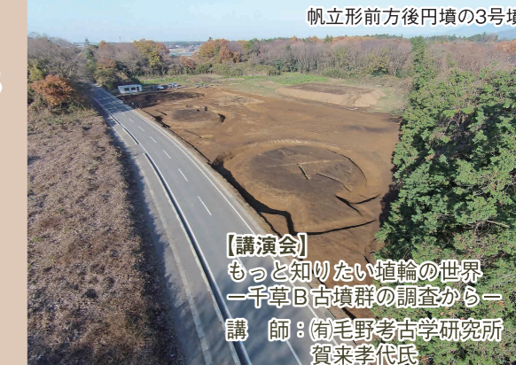
帆立形前方後円墳の3号墳

下妻市ふるさと博物館 下妻市長塚277番地(ピアスパーク手前) 0296-44-7111