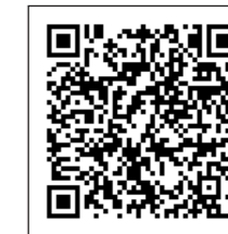
下妻市水道ビジョン

この「下妻市水道ビジョン」策定により、市水道事業の目指す基本理念である「安全・安心な市民生活を支える持続可能な水道」を実現に向け、「安全・強靱・持続」の視点から理想像・目標を設定し、課題の解決に取り組んでいきます。