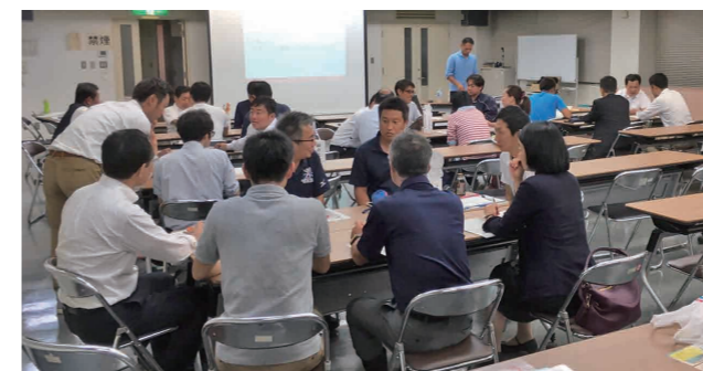
スポーツの活用をグループで話し合う参加者

「スポーツ」は、本来優勝劣敗や上手下手を比較することが目的ではなく、人々の暮らしを豊かにするための手段として生まれたものです。人々の暮らしには、働き、遊び、休み、学び、営みなどさまざまなシーンがありますが、それらが豊かになり、魅力化して行くことが、まちの引力を高め、にぎわいを生み出し、交流人口やインバウンド増加を誘発していきます。スポーツのこのような側面をまちづくりに活用した市の取り組みが、地方再生のモデルとして国土交通省と内閣府により選定されています。「寺虎家下妻覚醒編」は、モデル事業の一環として筑波大学発ベンチャー「(株)Waisportsジャパン」が展開する、スポーツの機能に関する知財提供プログラムによりスポーツの使い方を学び、まちづくりでの実践に繋げるものです。