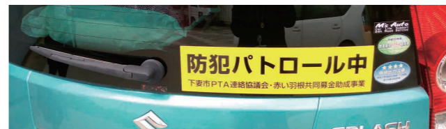
車両に貼られた防犯ステッカー

市PTA連絡協議会は、地域が一体となって子どもを見守ることを目的に赤い羽根共同募金の助成を受け、防犯ステッカーを作成しました。