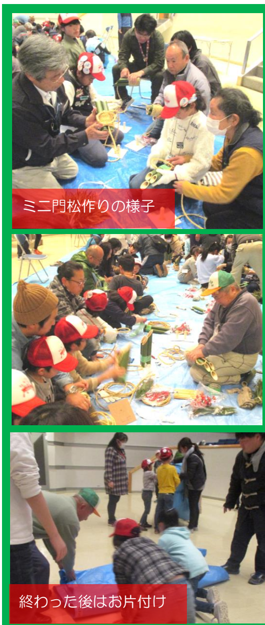
ミニ門松作りの様子

12月16日(日)「ものづくり&鬼怒川でクリスマス」を行いました。ものづくりでは、千代川公民館でミニ門松を作りました。今年も桜川どこでも竹とんぼクラブの皆さんに講師として来ていただき、ミニ門松の作り方を教えてもらいました。素敵な門松を作ることが出来て、団員たちは「早く飾りたい!」と言っていました(^)その後は、鬼怒フラワーラインに移動し、約10メートルの高さのツリーの柵に団員一人一人が書いた願い事のカードや松ぼっくり、装飾品を飾りました。飾り終わった後は団長と副団長による司会進行のもと、イルミネーションの点灯式を行い、「5・4・3・2・1・点灯!」の合図で輝き始めました。最後はサンタさんが登場し、一足早いプレゼントももらえて団員たちはとても嬉しそうでした♪ご協力くださいました皆様、ありがとうございました!