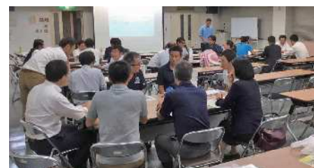
スポーツの活用をグループで話し合う参加者

「スポーツ」は、本来優勝劣敗や上手下手を比較することが目的ではなく、人々の暮らしを豊かにするための手段として生まれたものです。人々の暮らしには、働き、遊び、休み、学び、営みなどさまざまなシーンがありますが、それらが豊かになり、魅力化して行くことが、まちの引力を高め、にぎわいを生み出し、交流人口やインバウンド増加を誘発していきます。 スポーツのこのような側面をまちづくりに活用した市の取り組みが、地方再生のモデルとして国土交通省と内閣府により選定されています。「寺虎家下妻覚醒編」は、モデル事業の一環として筑波大学発ベンチャー「(株)Waisportsジャパン」が開催する、スポーツの機能に関する知財提供プログラムによりスポーツの使い方を学び、まちづくりでの実践に繋げるものです。