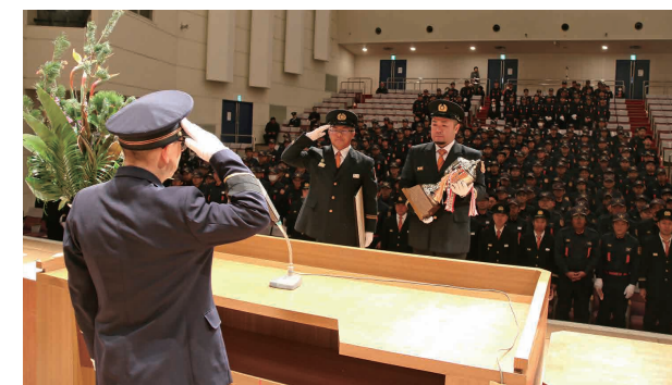
優勝杯などを受け取る消防団員