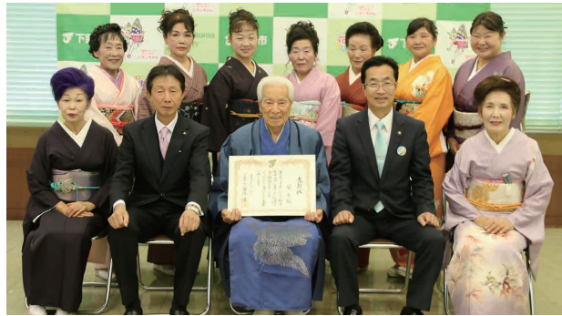
受賞を喜ぶ葵会の皆さん(下妻市役所本庁舎中会議室)

下妻市は12月20日、市役所本庁舎において、多年にわたり市政発展に尽力された団体に表彰状の伝達を行いました。