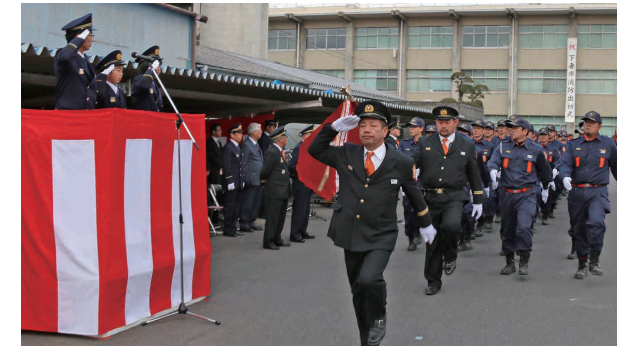
分列行進で入場する消防団員

新春恒例の「下妻市消防出初式」が1月13日、市役所本庁舎南側駐車場など3会場で行われ、住民の生命と財産を守る消防活動に決意を新たにしました。