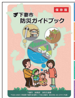
防災ガイドブック

なお、事業所の方などには配布していませんので、市ホームページからダウンロードをしてください。