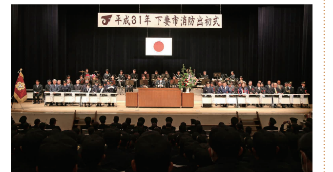
消防活動の功労者を称える表彰式