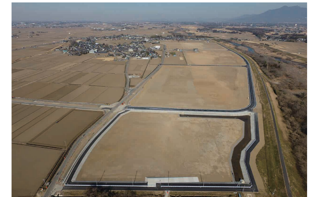
しもつま工業団地(鯨)の全景