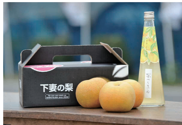
輸出などが期待される下妻の梨