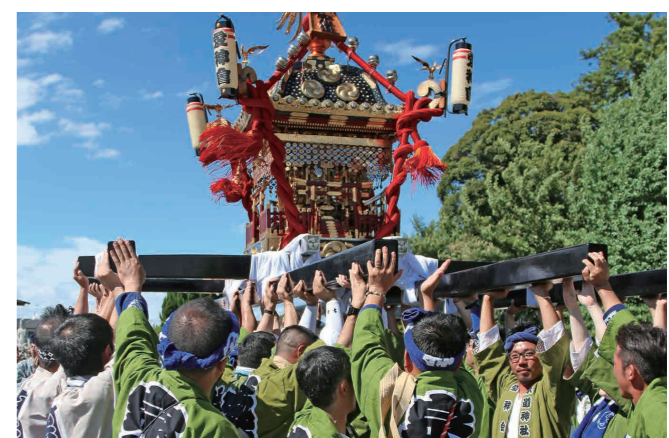
盛り上がる神輿渡御