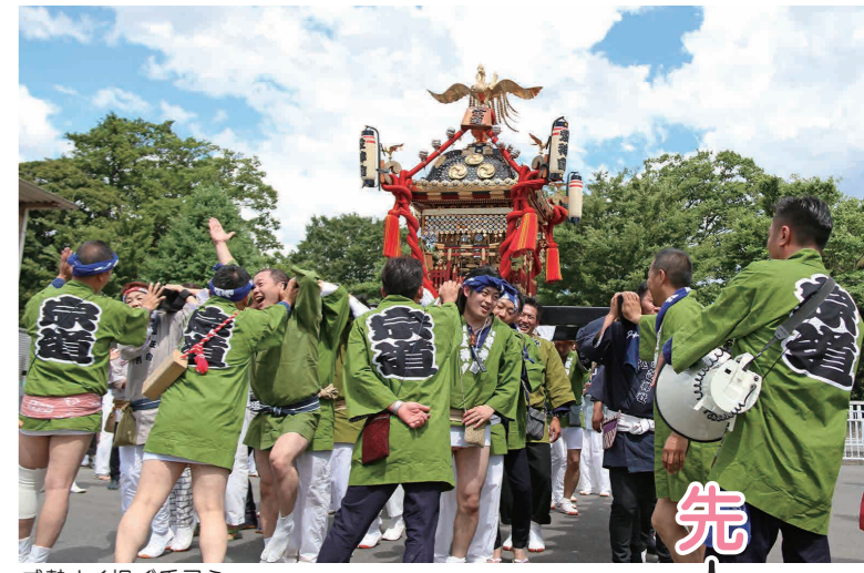
威勢よく担ぐ氏子ら

6月16日、宗道神社の神輿が完成100年を迎えたことを記念して、同神社周辺で「宗道神輿生誕100周年祭」が行われ、神輿渡御が行われました。神輿渡御は、同神社の氏子らで組織する宗道神社愛神會のほか、本宗道宗任會、原北友進會、皆葉祭神會の会員らによって神輿が担がれ、威勢よく神社周辺を練り歩いていました。