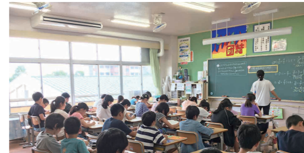
エアコンが設置された教室で授業を受ける児童たち(下妻小学校)

昨年の記録的な猛暑と近年の高温多湿の異常気象を受け、市では、子どもたちの健康管理と学習環境改善のため、3月からエアコン設置事業を行いました。この事業によって市内9小学校の普通教室へのエアコン設置が完了して、6月下旬から各教室で使用可能となりました。また、市内3中学校では昨年までにエアコンが設置され、市内全小中学校普通教室へのエアコン設置が完了し、子どもたちの学習環境改善が図られました。