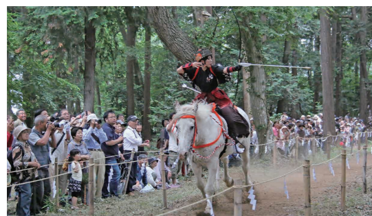
馬上から矢を放つ射手

大宝八幡宮で「流鏝馬神事」が行われ、古式ゆかしい狩り装束に身を包んだ4人の射手が駆け抜ける馬の背中にまたがりながら「いんよー(陰陽)」のかけ声とともに2カ所の的を射る姿に会場から大きな歓声と拍手が上がりました。