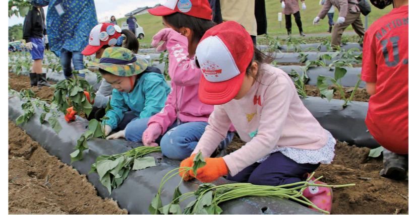
さつまいもの苗を植える参加者

鬼怒フラワーライン(鬼怒川大形橋上流左岸河川敷)で花と一万人の会が主催する「さつまいも定植大会」が開催されました。イベントには花万ジュニアスタッフや青龍楽校少年団、地域住民など約100人が参加し、花畑の一部に約1,200本のさつまいもの苗を植えました。