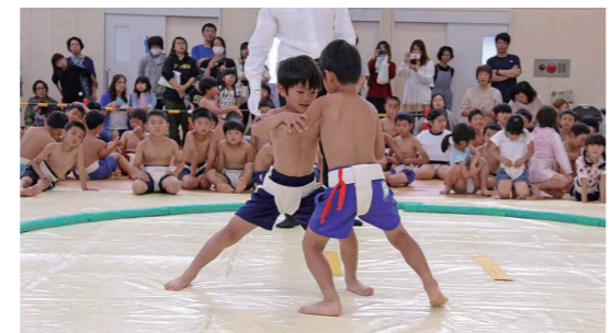
力いっぱい相撲を取る小学生(大宝小学校体育館)

各取組が行われると、呼び出しを受けた子ども力士たちは徳俵の前に立ち礼をしてから真剣な表情で熱戦を繰り広げ、応援に駆け付けた保護者たちなどから熱い声援が送られていました。