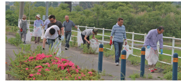
市道沿いを清掃する地域住民(二本紀地区)

6月2日、市内全域で「第38回市民清掃デー」および「いきいき茨城ゆめ国体クリーンアップ運動」を実施しました。今年も自治会などを中心に朝早くから約7,900人が参加し、きれいなまちづくりのために汗を流しました。地元の道路や河川、公園などの公共の場所で行われた環境美化活動により、可燃ごみ約1,185kg、不燃ごみ約632kgが回収されました。今後もみんなで身近な環境を守り、きれいで住みよいまちにしていきたいと思います。