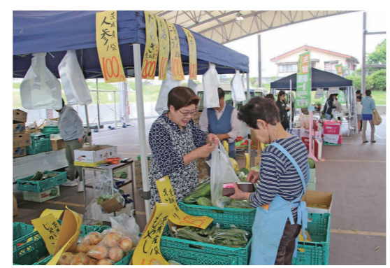
Waiwaiドームで新鮮野菜を買う来場者

軽トラ市は、今年から会場をWaiwaiドームしもつまに移し、しもつま生鮮軽トラ市実行委員会が7月、9月、11月の第2日曜日に9時から11時まで同会場で開催する予定です。来場者は、先着200人に1パック100円の卵や大津港(北茨城市)から届く干物などの水産加工品に列を作っていました。