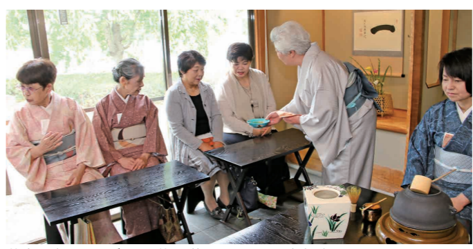
茶会を楽しみながら、お茶の説明に聞き入る参加者

砂沼広域公園・観桜苑の砂沼庵で6月9日、市茶道連盟香水出会が主催する「あやめ茶会」が開催されました。茶会には市内外から196人が参加し、作法や服装を気にせず、本格的な抹茶と鮎や波紋をあしらった季節の和菓子を堪能しました。