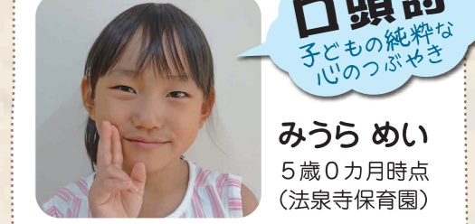
みうら めい 5歳0カ月時点 (法泉寺保育園)

おつきさま ママ おつきまがついてくるよ おつかひついでよ ママ こぼれん おつきま おなすいたて いっしょにほんたへよう