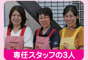
専任スタッフの3人