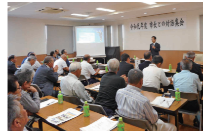
要望に回答する市長(千代川中学校区)