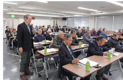
施策を提案する区長(下妻中学校区)