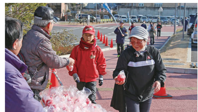
ミニだるまを受け取る参加者