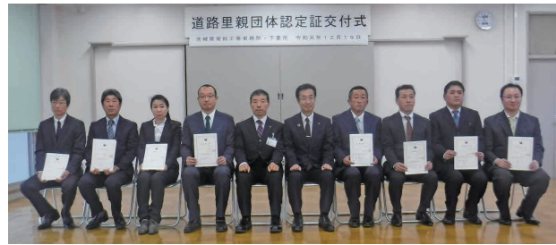
新たに認定を受けた8者

12月19日、常総工事事務所で道路里親制度協定調印式および認定証交付式が行われ、国道125号、県道結城下妻線などにおいて道路の里親団体として新たに認定され、同事務所、里親団体8者、下妻市により協定が締結されました。この道路里親制度は、茨城県が管理する道路を住民団体、企業、学校などが、その道路の里親として認定を受け、清掃(ゴミ拾い)や除草・花壇の手入れなどの活動を行うボランティア認定制度で、今回認定された8者を含め市内11団体が認定されています。