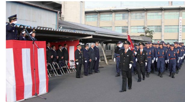
分列行進で入場する消防団員