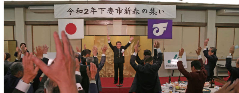
さらなる飛躍の年を祈念して万歳三唱

下妻市、下妻市商工会、常総ひかり農業協同組合の共催による「令和2年下妻市新春の集い」が1月16日、八幡屋(長塚)で開催されました。集いには、地元選出の国会議員、県議会議員、市議会議員、各種団体や市関連企業の代表者など242人が参加。新年のあいさつを交わしながら、市の発展を誓い合いました。