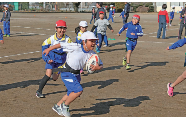
ラグビーボールを追いかける児童たち