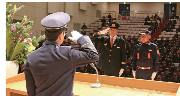
消防活動の功労者を称える表彰式

新春恒例の「下妻市消防出初式」が1月12日、市役所本庁舎南側駐車場など3会場で行われ、住民の生命と財産を守る消防活動に決意を新たにしました。