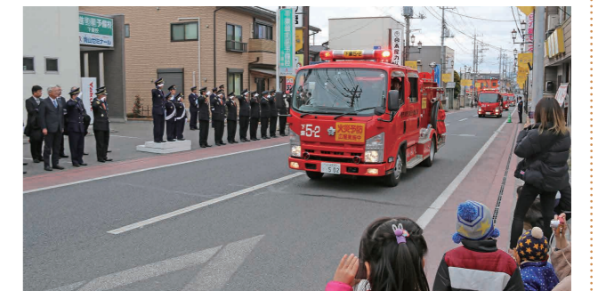
駅前通りでの消防車両パレード

下妻駅前通りに移動して行われた消防関係車両27台によるパレードでは、菊池市長と一日点検官が車両の観閲を行いました。