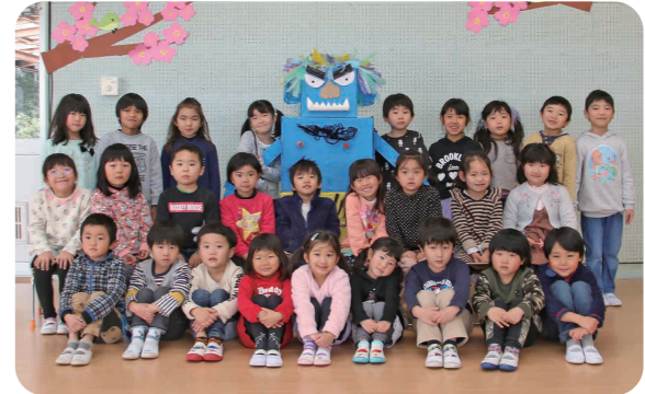
▲はな組・にし組の皆さん

幼稚園では毎年、「鬼を追い払って幸せに過ごしましょう!」という思いを込めて、豆まきをしています。今年、はな組さんとし組さんの子どもたちがイメージした鬼は、角が大きくて、私たちが食べちゃいそうな怖い鬼だったようです。それを大きな段ボールや廃材を使って製作しました。2月3日は「鬼は外!福は内!」と威勢のいい声で鬼に立ち向かう子どもたちの姿が見られるでしょうね。さあ!みんなで元気に豆まきしましょう!!