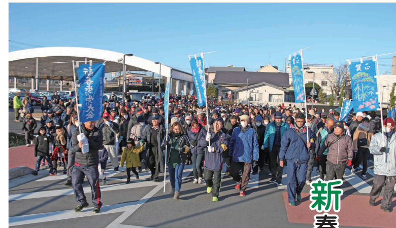
一斉にスタートする参加者たち

下妻市恒例の「新春歩け歩け大会」が1月3日の早朝、Waiwaiドームしもつまを発着点に、市民など約680人が参加して行われました。完歩後は、完歩賞のミニだるまが手渡されたほか、温かいお汁粉が振る舞われ参加者たちは疲れを癒していました。