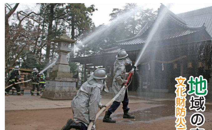
拜殿へ放水する消防団員(第3分団)たち

地域の宝を火災や自然災害から守ろうと、国指定の重要文化財「大宝八幡宮本殿」を有する大宝八幡宮の境内で1月26日、消防訓練が行われました。下妻消防署や地元の消防団、八幡宮職員、地元住民など約80人が参加しました。