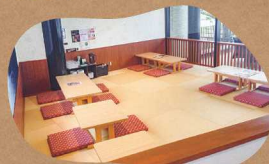
畳のスペースもあります