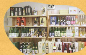
地元の酒蔵で醸造している名品の お酒や焼酎、ワインなどを揃えています