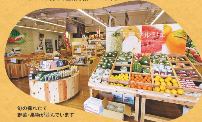
旬の採れたて 野菜・果物が並んでいます

市内・近隣・県内各地域の農家さんから毎日採れたての野菜や果物が入荷します。その他、県内のブランド肉、豊富な銘柄米、地元酒蔵の酒や焼酎、納豆、乾燥イモ、お茶など、生産者の自慢の逸品が並びます。乾物コーナーでは昆布や豆類も揃えています。