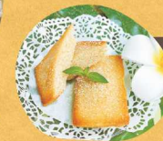
下妻甘熱梨 フィナンシェ 下妻産産を 使用した当施設の オリジナル菓子