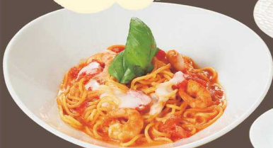
下妻トマトパスタ