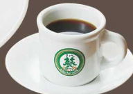
葵ブレンドコーヒー