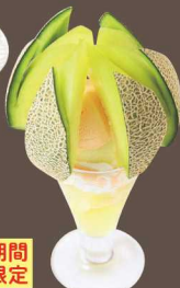
イバラキングバフェ