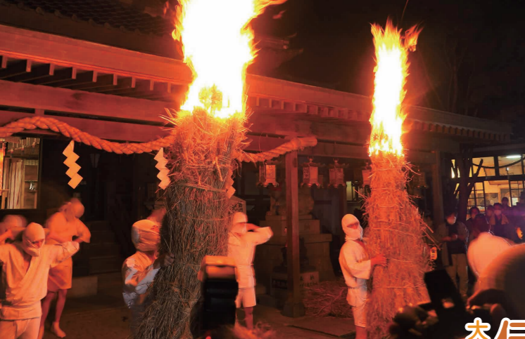
松明を掲げる白装束の若者

大宝八幡宮で開催された恒例のタバカ祭は、応安3年(1370年)大宝八幡宮が出火した際に、畳と鍋蓋で鎮火させたと言われる故事を、儀礼的に再現しています。