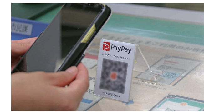
スマートフォンなどのアプリでQRコードを読み取ります