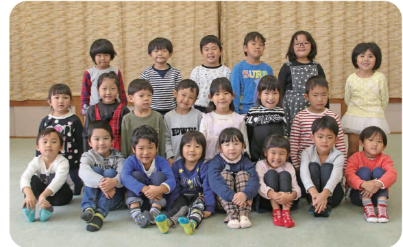
▲たんぼ組、さくら組の皆さん

食欲の秋ということで、今月は秋の味覚「栗」の製作を行いました。いがの部分は丸く切ったダンボールに切り込みを入れ、毛糸を巻き付け栗の実は、紙粘土で形作り色を塗りました。栗一つ一つに顔も描き、とても可愛らしい栗に仕上がりました。秋の实りを楽しんで表現することができました。