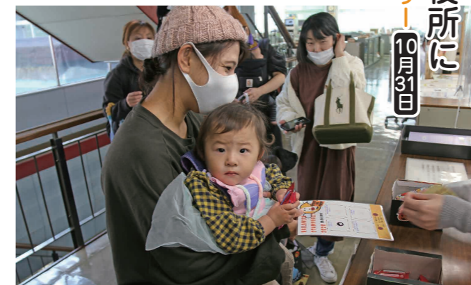
どんなシールがもらえたかな