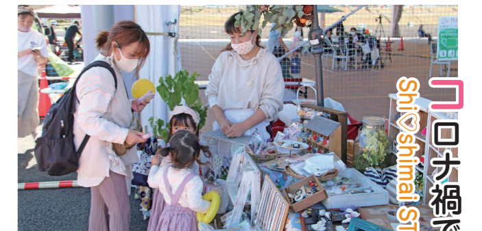
商品を選ぶ来場者

コロナ禍でも安心・安全に楽しめるイベントのモデルケースを作ろうと、Shi♡shimaiが主催し、Waiwaiドームしもつまをメイン会場として開催されました。会場はこのほかにリフレこかい、めぐりあい広場たかさいに設置し、メイン会場の様子をオンラインで見ることができました。また、参加者は好みの会場で、思い思いの時間を過ごしていました。このイベントは、市の特産物のPRや社会全体での子育てを支える環境づくり、女性の活躍の場の提供などについても事業のねらいとしており、プロのミュージシャンによる音楽ライブや、ハンドメイドサークル「陽だまりマルシェ」による販売も行われました。