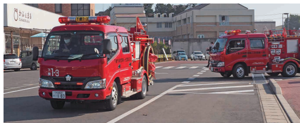
広報パレードに出発する消防団の車両

11月15日、市消防団などの車両25台による秋季全国火災予防運動広報パレードがWaiwaiドームしもつまから出発し、市内3コースに分かれ火災予防を呼びかけました。