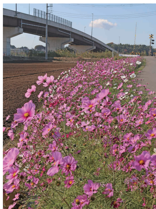
大宝跨線橋(上)と満開のコスモス