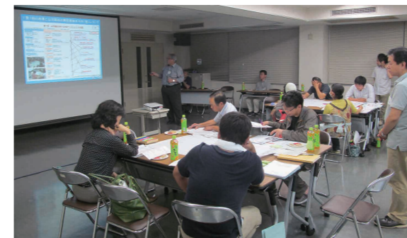
課題について検討する参加者

下妻市公共施設再配置計画の策定にあたっては、公共施設の現状と課題を市民の皆さまと共有し、 公共施設の将来のあり方について具体的な検討を行う市民ワークショップを開催しました。市民ワ ークショップでは、下妻市の公共施設の現状や他の市町村の先進事例などを紹介し、将来の公共施 設の再編について、グループワークを実施しました。