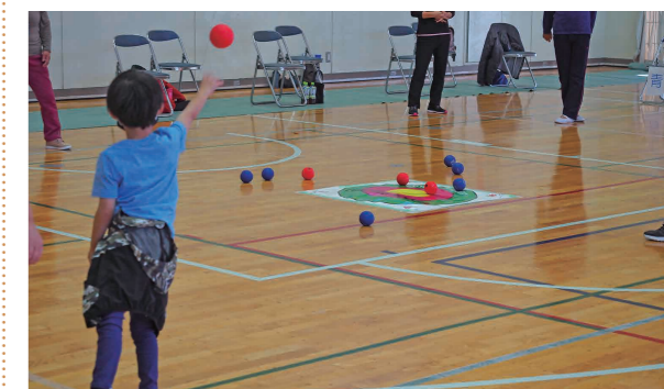
「カーリングポッチャ」を楽しむ参加者

参加者の40代女性は、「新型コロナウイルスの影響で、リフレッシュする場がないので楽しむことができました。こうした場をできるだけ増やしてもらえればと思います」と話していました。