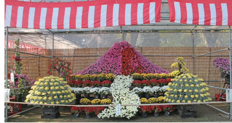
色彩豊かな特作花壇