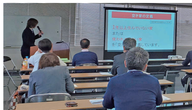
講師の話に聞き入る参加者

セミナーには22人が参加し、空き家が解決できない要因や、空き家問題を子供に引き継がないようにすることなどについての講義を受講しました。参加した60代の女性は「現在、実家が空き家になっておりどうしたらいいのか迷いながら片付けを進めています。この先の筋道が見えたので来てよかったです」と答えていました。