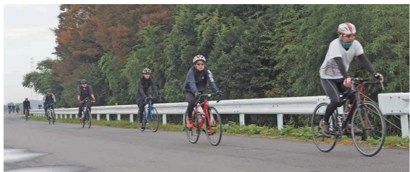
鬼怒川・大形橋付近を試走する参加者

試走後に行われた意見交換会では、「筑波山を見ながら走ることができた」「地元の名所巡りができた」と評価する一方、「コースを簡略化すべき」「危険と思われる箇所もあり改善が必要」との提案がなされました。