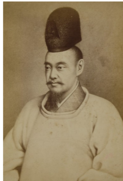
斉昭肖像画写真

水戸藩9代藩主徳川斉昭によって創設され、日本遺産にも認定された弘道館と偕楽園は、斉昭の獨創性が発揮された他に類を見ない施設です。斉昭に関する資料を交えてその特色を紹介します。