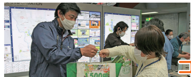
取れたての新鮮野菜を販売しました

ピアスパークしもつま(指定管理者・(株)クリーン工房)では、新型コロナウイルスの影響による需要減などにより経営に打撃を受けている農産物生産者を支援するため、本館前ロータリーでのドライブスルー形式や出張販売による農産物直売を実施。農産物は、キャベツやネギなどを箱詰めにし、1,000円~3,000円のセットとして販売しました。