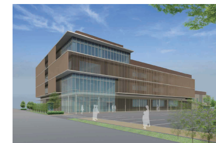
外観イメージ図(基本設計段階)

事業名称：下妻市庁舎等整備工事 場 所：茨城県下妻市本城町三丁目13番地、36番地1ほか 事業期間：契約締結日翌日から令和5年(2023年)10月31日まで 契約者名：清水・塚田・楠山特定建設工事共同企業体 (代表企業：清水建設株式会社関東支店) 契約金額：50億9,960万円(税込)