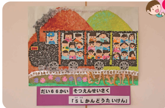
だい66かい そつえんせいさく 「SLかんとどうたいけん」

秋に年長組は「SL感動体験」に行ってきました。貸し切り列車から感動した思い出を卒業制作にまとめました。「せんろはつづくよどこまでも〜♪」と思わず口ずさみながら絵の具で山を塗ったり、ちぎり絵でSLや路線を作り、星組25人を乗せて完成しました。いつまでも子どもたちの心の中に楽しかった感動を忘れずにいて欲しいです。