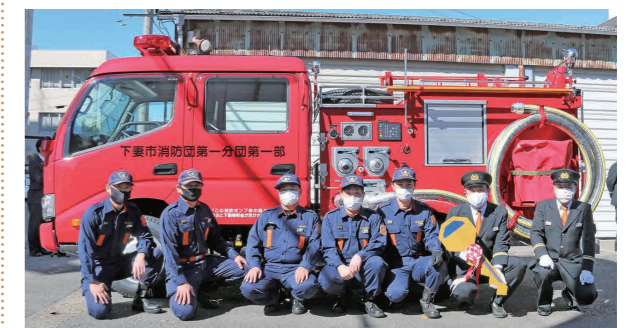
配備された消防ポンプ自動車と下妻市消防団第1分団の団員の皆さん

納車式後、第1分団の司代分団長は「新車両の導入は、かねてより要望をしていたものです。新しい車両はオートマチック車であり、団員にとって利便性の向上が期待されます。これまで以上に活動がしやすくなると思っています」と話していました。