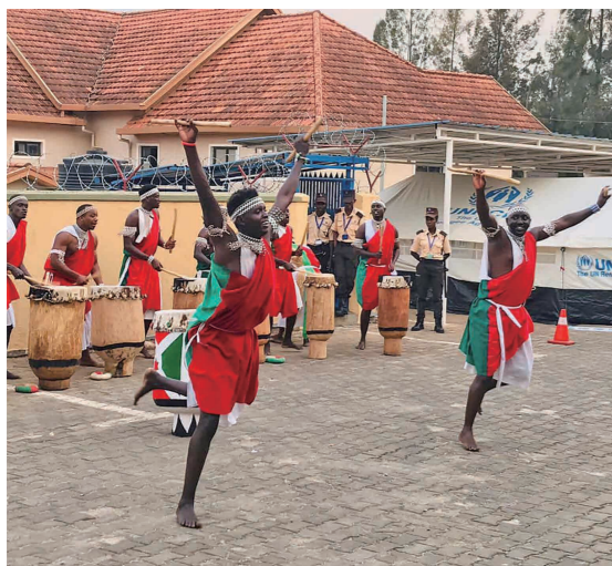
インゴマの太鼓の音に合わせてリズムカルに踊る男性

ブルンジの伝統文化に「INGOMA(インゴマ)」と呼ばれる太鼓の演奏があり、2014年にユネスコの世界無形文化遺産に登録されました。ドラムに合わせて踊ったり高く飛び跳ねながら演奏する太鼓は圧巻です!国の式典や賓客がある時には、プロのインゴマ奏者達が迫力ある演舞を披露します。