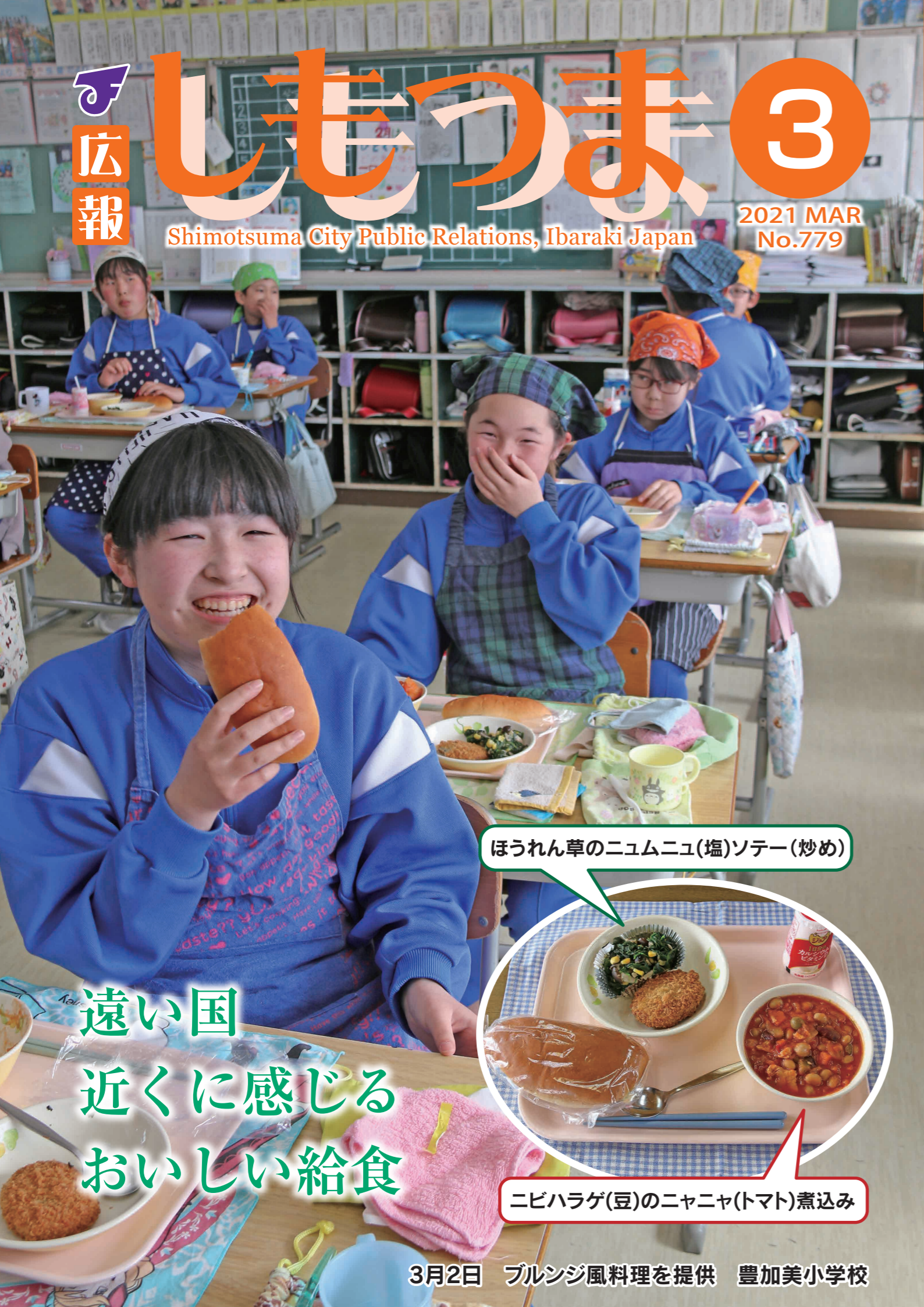
ほうれん草のニユムニユ(塩)ソテー(炒め)