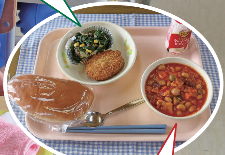
ニビハラゲ(豆)のニヤニヤ(トマト)煮込み