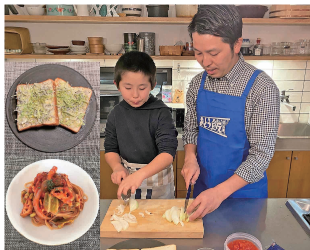
【菊地さんちのおとう飯】