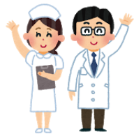
【表2：胃バリウム検査を希望しない方(特定・基本健診) 会場：市保健センター】