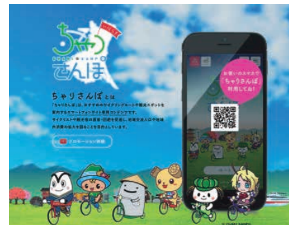
茨城県サイクリングルート紹介HP「ちやりさんぽ」への追加