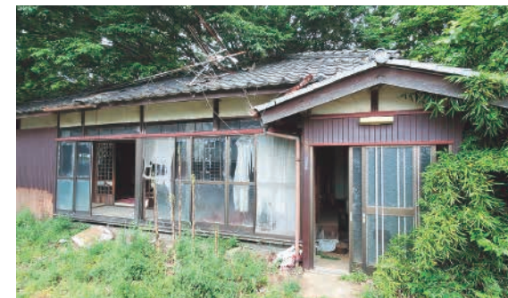
管理されていない空き家

相続放棄などにより所有者や相続人がいない場合であっても、市や国の所有物にはなりませんので、市や国では除草などの管理を行いません。