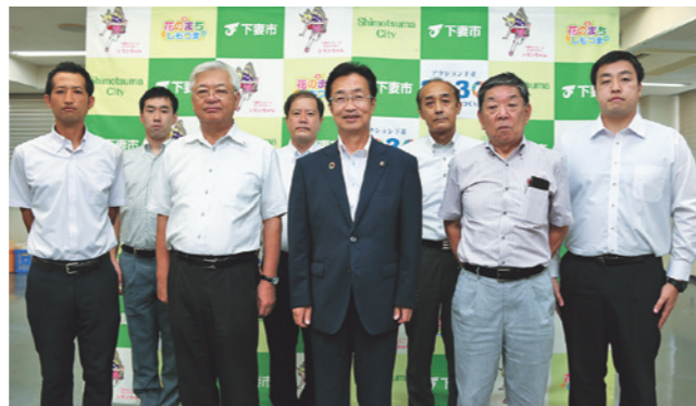
菊池市長(前列中央)、廣瀬市議会議長(市長右側)を学校関係者が表敬訪問しました