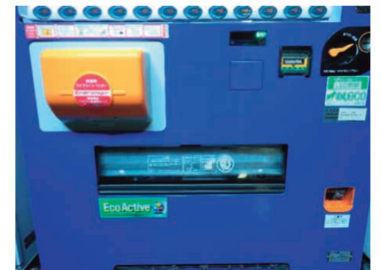
災害時対応型自動販売機▶

災害時拠点となる施設に設置している一部の自動販売機については、設置事業者との協定書をもとに、災害時に自動販売機の商品を無償提供することが可能となっています。