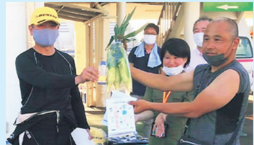
筑波サーキットでの「地域おこし協力隊賞」の贈呈

東京2020オリンピック・パラリンピックでは『下妻ブルンジ選手団支援委員会』に所属し、ブルンジ共和国の選手団に下妻の農業の魅力を伝えたいという思いから、市内農家やJA常総ひかりとのつなぎ役をしていました。思いを選手団に伝える手段として、応援メッセージ動画撮影、下妻梨等の寄贈などに立ち合わせていただきました。このご縁が今後の農業や海外交流につながることを願っています。