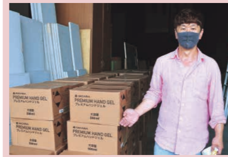
ハンドジェルは(株)洋光の担当者が持参しました

8月3日、化粧品などの輸出入販売を手掛ける(株)洋光(東京都)から、500ml入りのアルコールハンドジェル6,220本が寄贈されました。寄贈されたハンドジェルは、今後、新型コロナウイルス感染症予防のため市役所庁舎をはじめ市の公共施設で活用します。ありがとうございました。