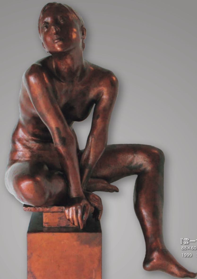
『雲一つ』 FRP 88×60×53 1999 第31回日展