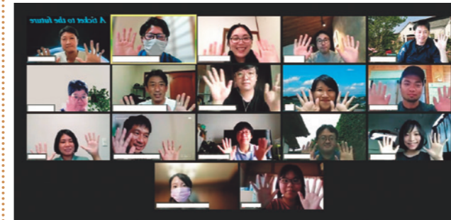
イベントは、Web会議アプリを使って行いました

8月21日、若い世代の人的ネットワークおよび活動機会の創出を目的とした「しもつまフューチャートーク」をオンラインで開催しました。当日は20～30代の世代を中心に19人が参加し、地域おこし協力隊員など5人のスピーカーによる「7分間マイストーリー」などを配信しました。