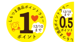
※このシールが対象商品に貼られています