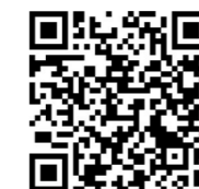
下妻市観光協会ホームページ