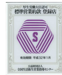
左図：Sマーク登録店に掲示されている標識