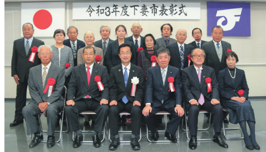
※写真撮影の時のみマスクを外しています