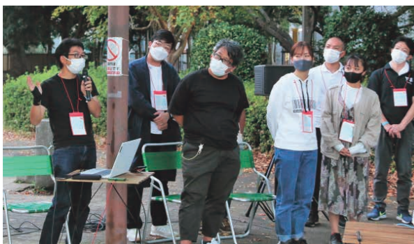
プレゼンテーションする参加者