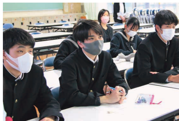
市職員の講義を聞く二高生

10月27日には、市職員から市が抱える課題や推進する事業についての講義を受け、まちづくりで大切なこと、子どもの貧困問題、道路整備についてなど、活発な意見交換がされました。今後、来年1月の学内での発表に向けて学習が進められていきます。